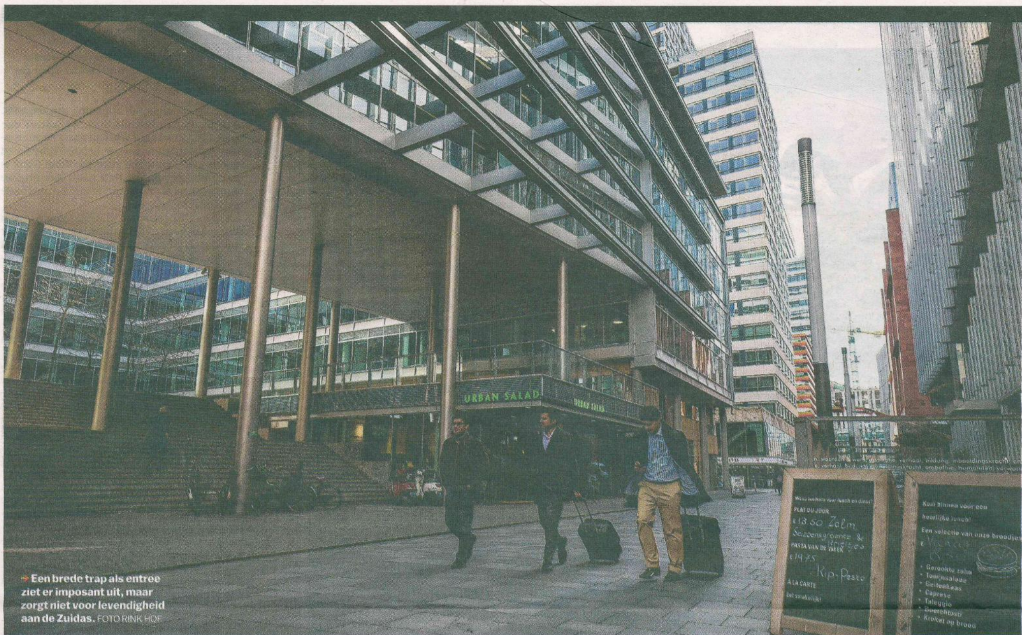
→ Een brede trap als entree ziet er imposant uit, maar zorgt niet voor levendigheid aan de Zuidas.

Hoogbouw Leer van verschillen en laat politieke sneren achterwege